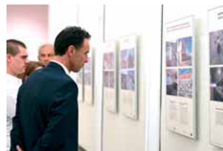
Izložba »Stoljeće i pol riječkih pruga« u Opatiji

Javnosti i posjetiteljima bila je dostupna i Vinkovačka željeznička zbirka Hrvatskoga željezničkog muzeja izložena u željezničkome kolodvoru u Vinkovcima, koju su prošle godine zahvaljujući stručnim