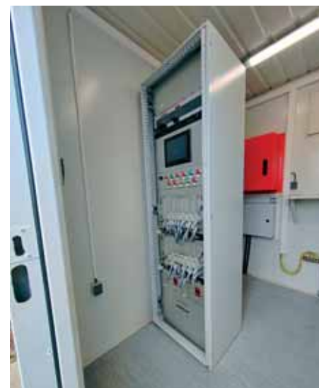
Sustav osiguranja ŽCP-a

Sveta Klara jest specifično naselje koje je omeđeno željezničkim prugama na kojima postoji čak pet ŽCP-ova. Nakon ovog