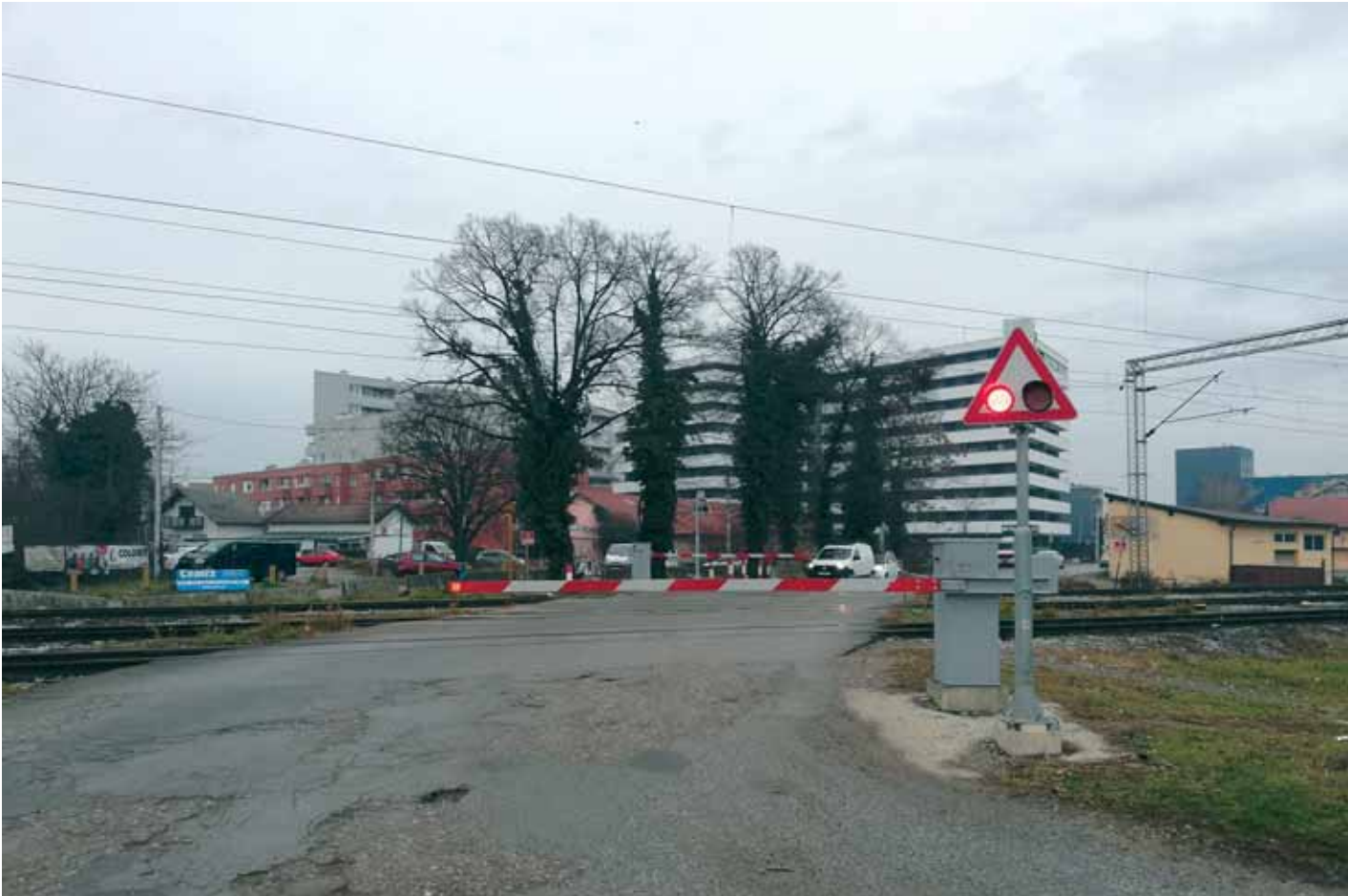
Novi polubranici i svjetlosno-zvučna signalizacija na ŽCP-u »Horvatoва«

projekta svi su osigurani automatskim uređajima koji uključuju svjetlosno-zvučnu signalizaciju i polubranike.