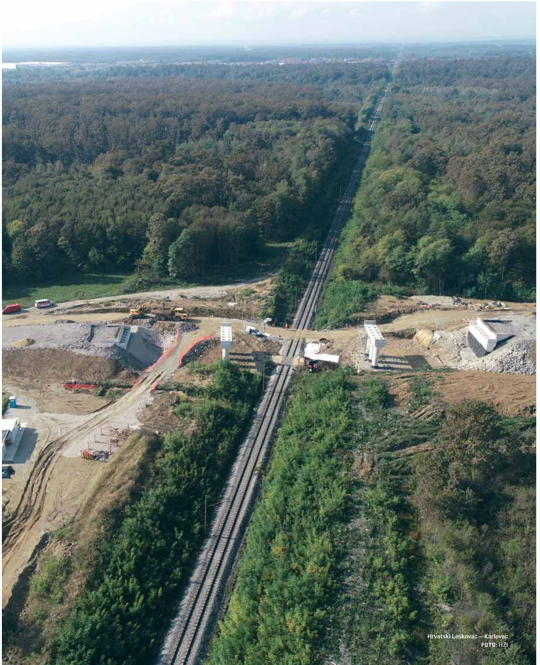
Hrvatski Leskovac – Karlovac