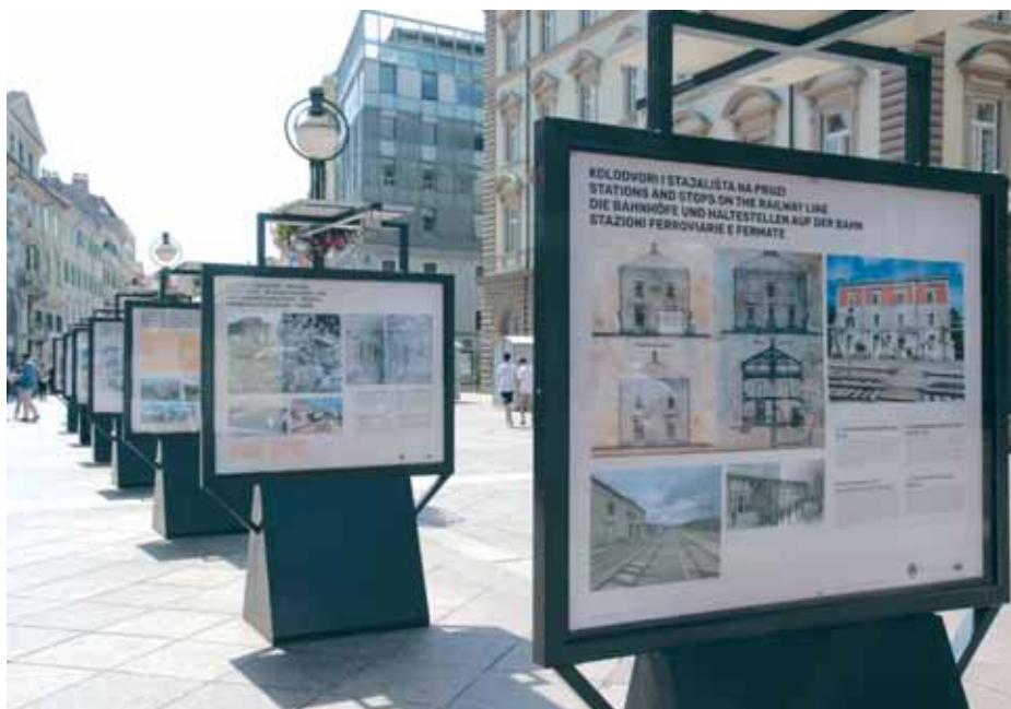
Izložba »Željeznica u Rijeci« na riječkom Korzu

prostoru – Umjetničkome paviljonu »Juraj Šporer« u Opatiji, gdje je u suradnji s