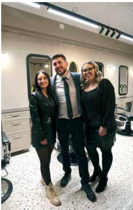
Vlasnik salona i kolegice

novnu školu i često se igrao u blizini željeznice i u kolodvoru. Prije frizerskog salo-