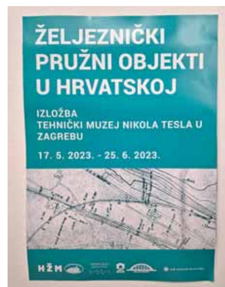
Plakat izložbe »Željeznički pružni objekti u Hrvatskoj«