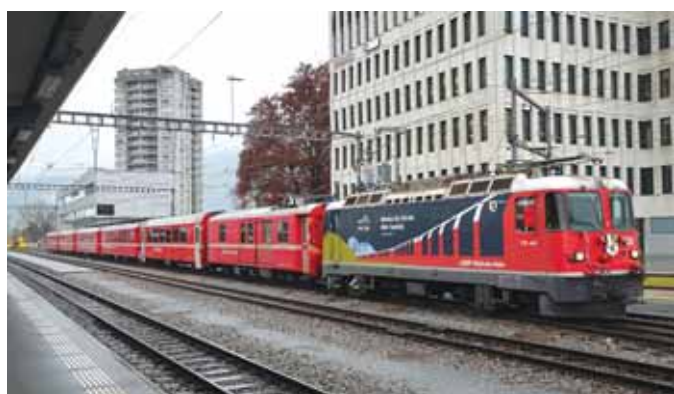
RhB-ova lokomotiva Ge 4/4 II u posebnom bojenju u Landquartu