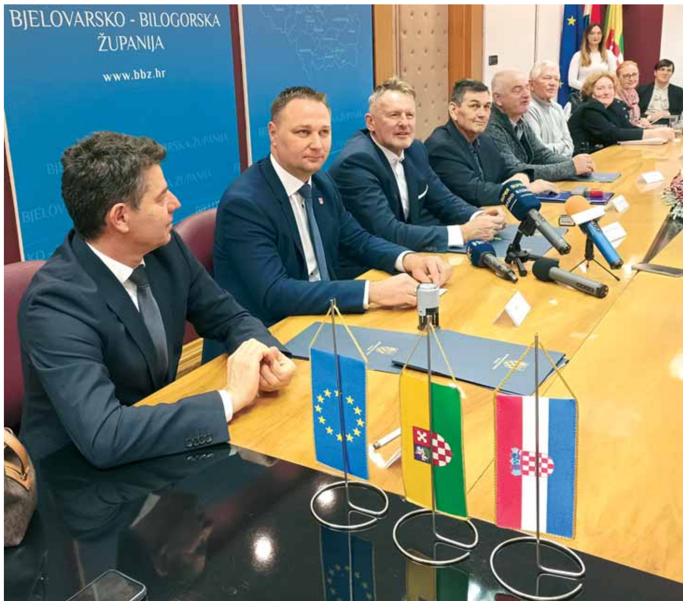
Predstavnici HŽPP-a, Županije, Čazmatransa i Udruge tjelesnih invalida Bjelovar

„Moram iskazati zadovoljstvo jer ostvarujemo višegodišnju uspješnu suradnju s Bjelovarsko-bilogorskom županijom, ali i posebno zadovoljstvo zbog ovoga jedinstvenog sastanka gdje smo okupljeni i mi kao željeznički prijevoznik te autobusni prijevoznici. To je onaj put na kojemu bi