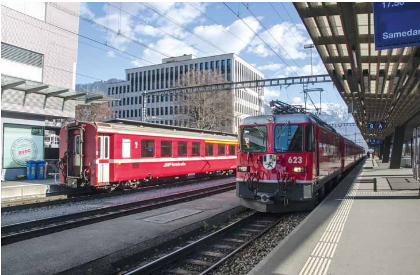
Uskotračni kolosijeci kolodvora Landquart i RhB-ov vlak prema Klostersu

L andquart je gradić u istočnošvicarskome kantonu Graubündenu, koji se nalazi na ušću rječice Landquarta u Rajnu. Landquart se razvio oko istoimenoga kolodvora spajanjem nekoliko starijih naselja u jednu cjelinu. Treće je naselje po veličini u kantonu, i to nakon obližnjeg Chura, koji je ujedno glavni grad Graubündena, i poznatog Davosa. Chur se nalazi južno od Landquarta, u dolini rijeke Rajne.