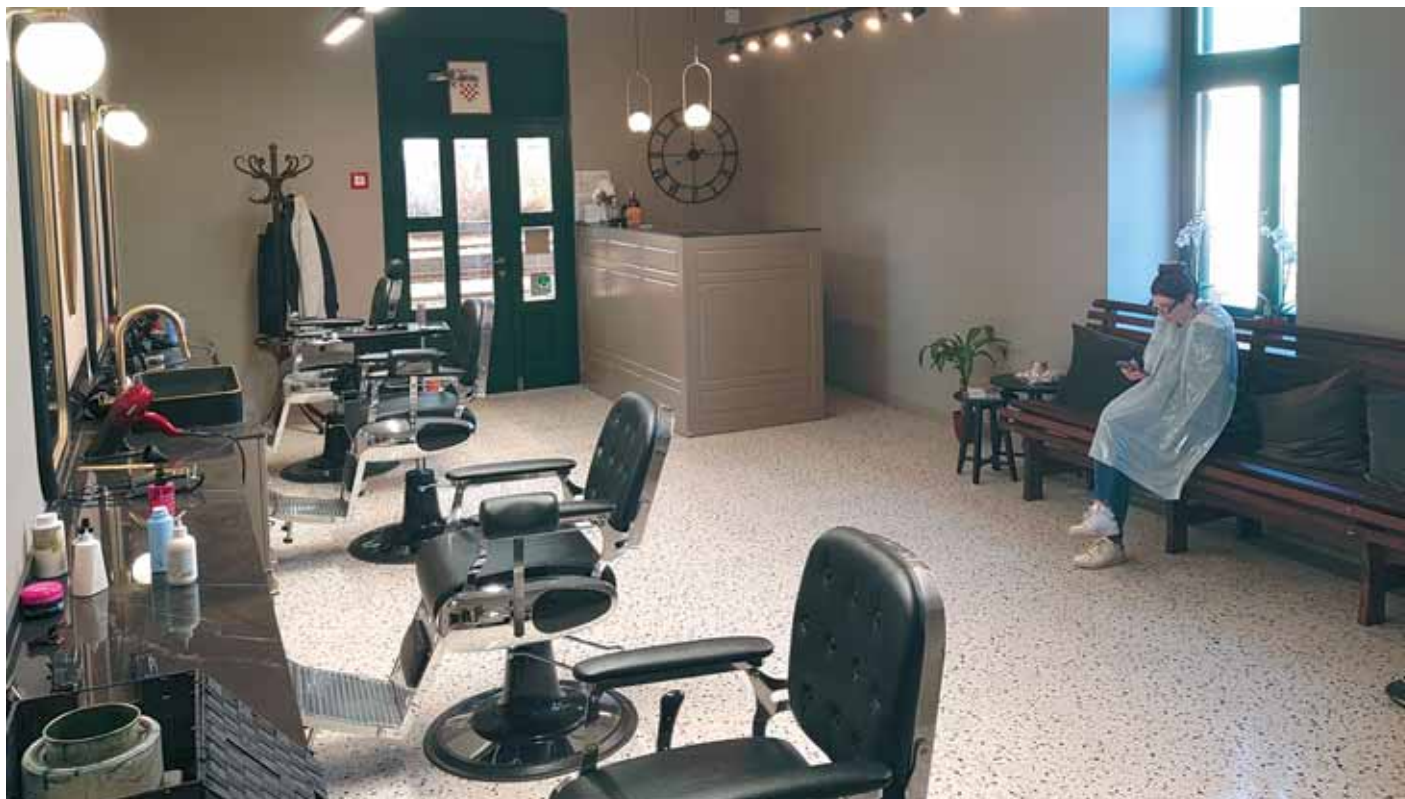
U ponudi su i frizerske usluge za žene

na u tom je prostoru bio kafić koji je Mišel posjećivao. Kaže da tada nije mogao ni slutiti da će mu jednoga dana tu biti radno mjesto.