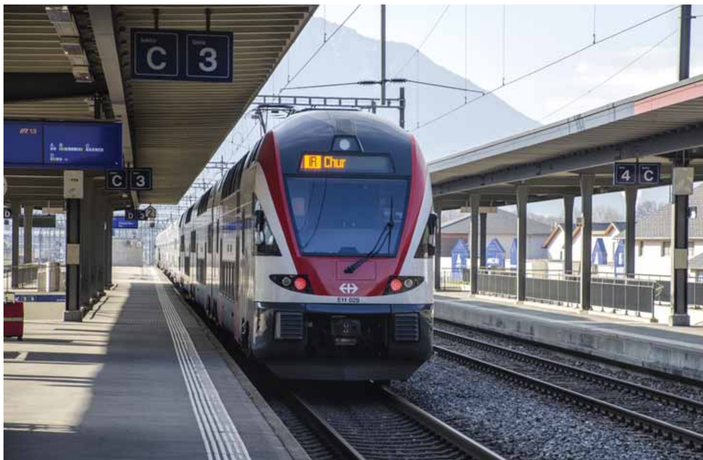
SBB-ov interregionalni vlak za Chur