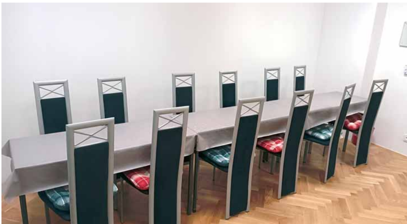
Novi namještaj u KŽU-u Osijek

svjedočenja) o željeznici koju koriste za pisanje knjiga te postavljanje muzeja i izložbi. Vladimir, već spomenuti član Kluba,