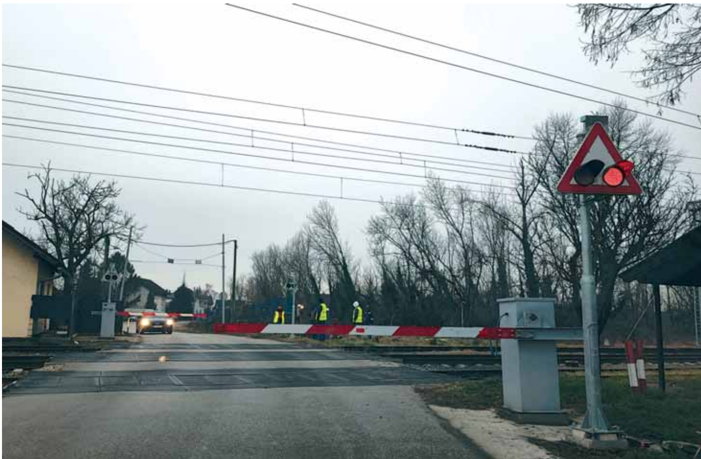
Novi polubranici i svjetlosno-zvučna signalizacija na ŽCP-u »Mrkšina«

PIŠE: Željka Miša