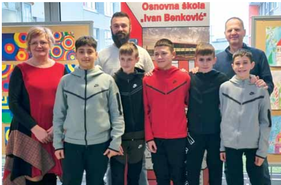
Prometnika su željeli upoznati i intervjuirati učenici novinarske grupe

mlade entuzijaste koji jednoga dana svoju ljubav mogu pretvoriti u zanimanje. Da je posao lak, nije, ali da je zanimljiv, itekako jest. Preporučio bih ga mladim ljudima.