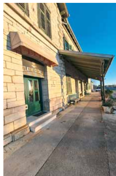
Ulaz u frizerski salon/briačnicu na peronu

Ovo je drugi frizerski salon koji danas radi u sklopu željezničkih kolodvora u Hrvatskoj. Najdugovječniji je brico u Vinkovcima, čija briačnica tamo postoji otkako i sama kolodvorska zgrada – već gotovo 60 godina.