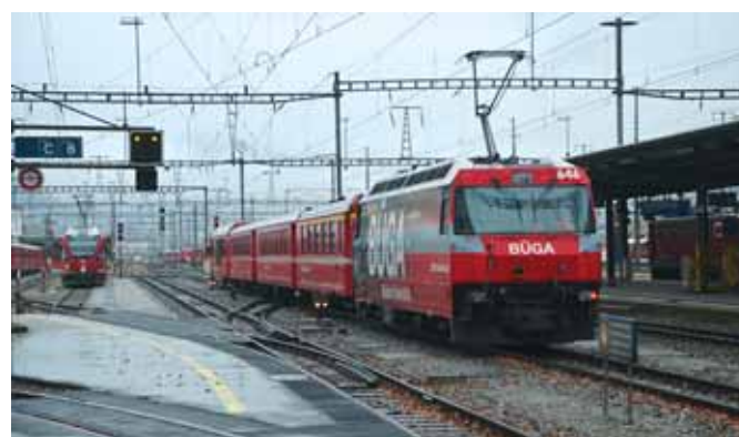
Uskotračni vlak za Sankt Moriz u Landquartu

malnotračni kolosijeci na njegovoj zapadnoj strani. Između kolosijeka normalne širine i rijeke Rajne nalaze se mali trgovač-