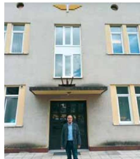
Nadzorno središte Varaždin