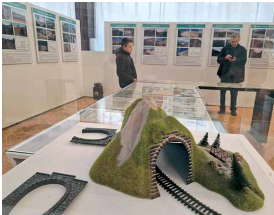
Izložba »Željeznički pružni objekti u Hrvatskoj« u Zagrebu

Nakon kratke ljetne pauze izložbenu aktiv-