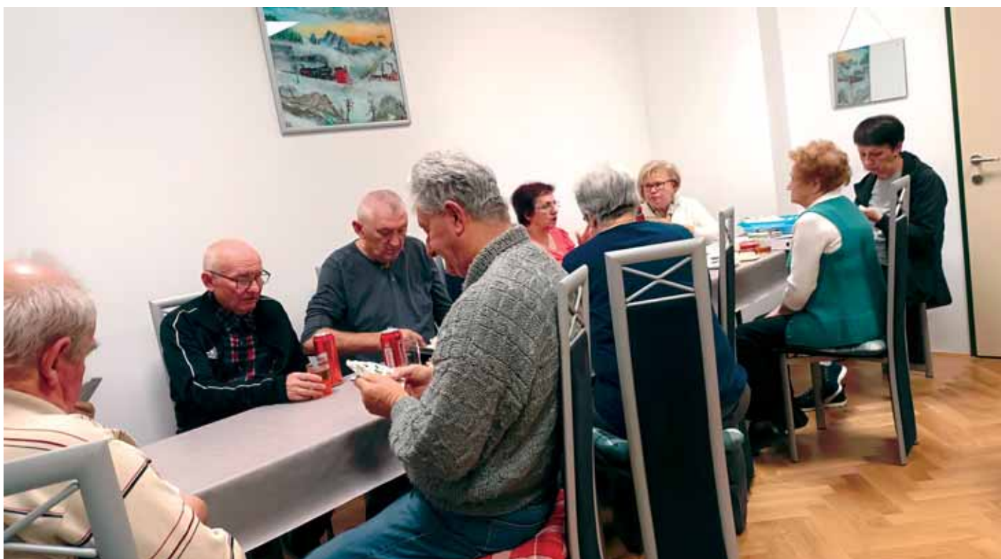
Ugodno druženje u KŽU-u