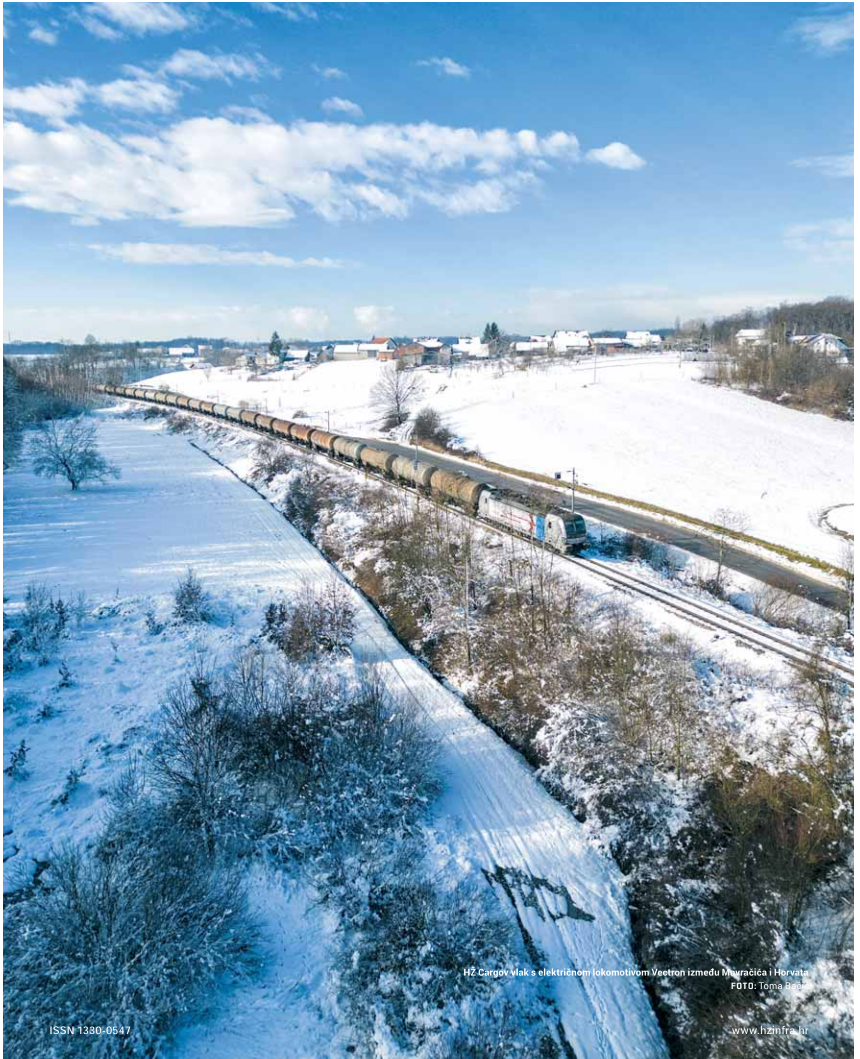
HŽ Cargov vlak s električnom lokomotivom Vectron između Mavračića i Horvata