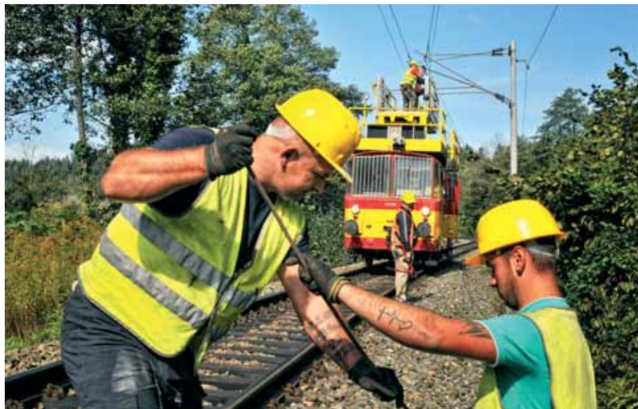
Uklanjanje klizne žice s pruge

Žica sa stupova savija se i zveči pri padu na pružni dio, prerezana je na točno predviđenoj duljini i treba je oblikovati u kolut i pripremiti za otpremu. Na terenu nema previše radnika, svaki je na svojem mjestu. Posao teče, baš kao i pruga koja vijuga poput nekog beskonačnog konopca