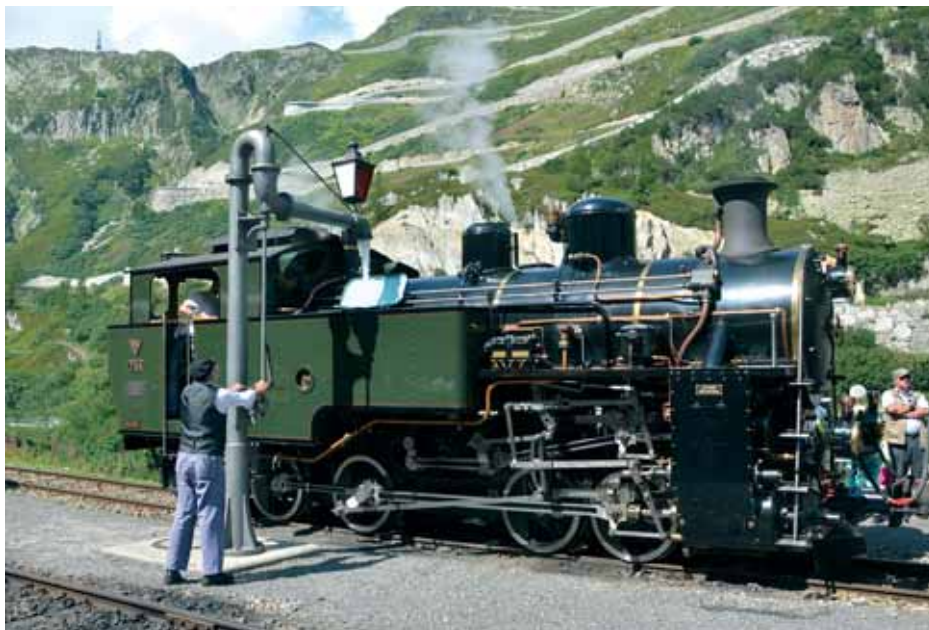
Vijetnamska lokomotiva HG 4/4 704 u kolodvoru Gletsch