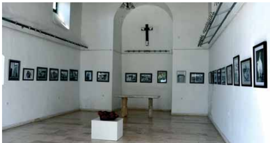
Izložba u Kninskoj tvrđavi