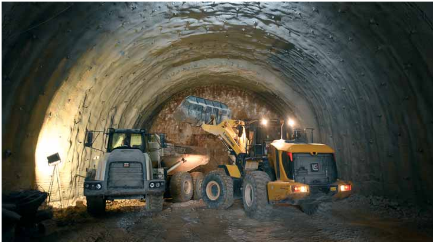
Radovi na proširenju tunela

Sufinancirano instrumentom Europske unije za povezivanje Europe