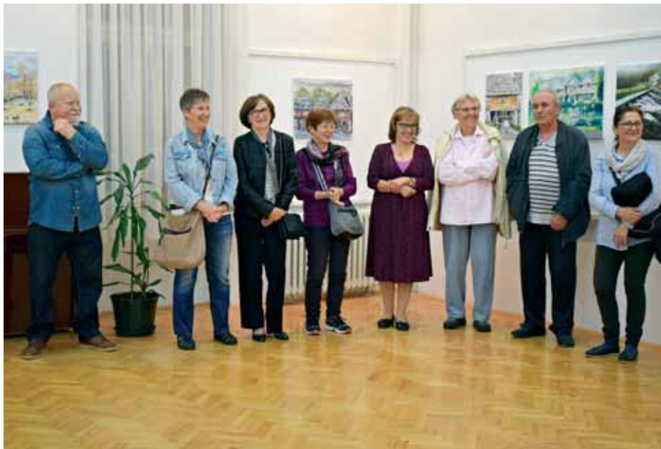
Sudionici 13. LIKOM-a

Radovi nastali na koloniji predstavljeni su na izložbi koja je otvorena u nedjelju 8. rujna u izložbenoj dvorani Gackoga pučkog