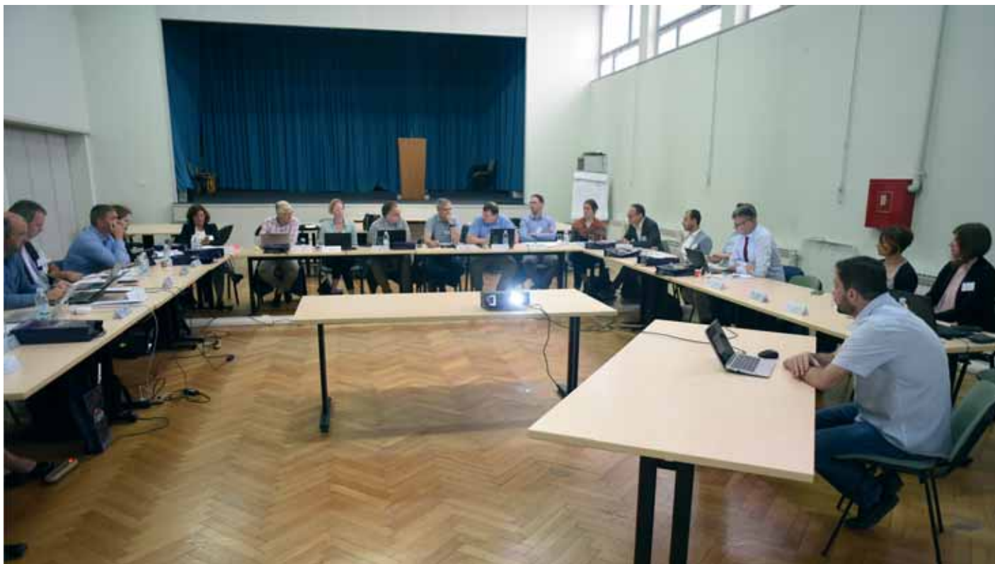
Sastanak radne skupine CHRISTINE ( Charging Railway Infrastructure in Europe )

Sljedeći sastanak CHRISTINE održat će se 2020. u Francuskoj.