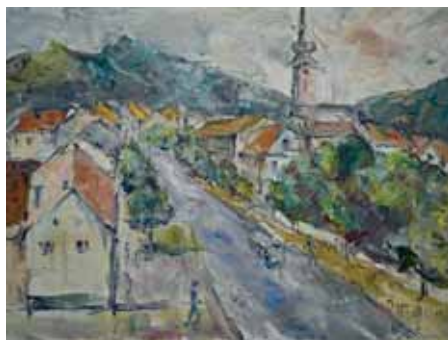
Autorica Ivanka Švabek

otvorenog učilišta Otočac. Izložba se može razgledati do 11. listopada 2019., a ulaz je slobodan.