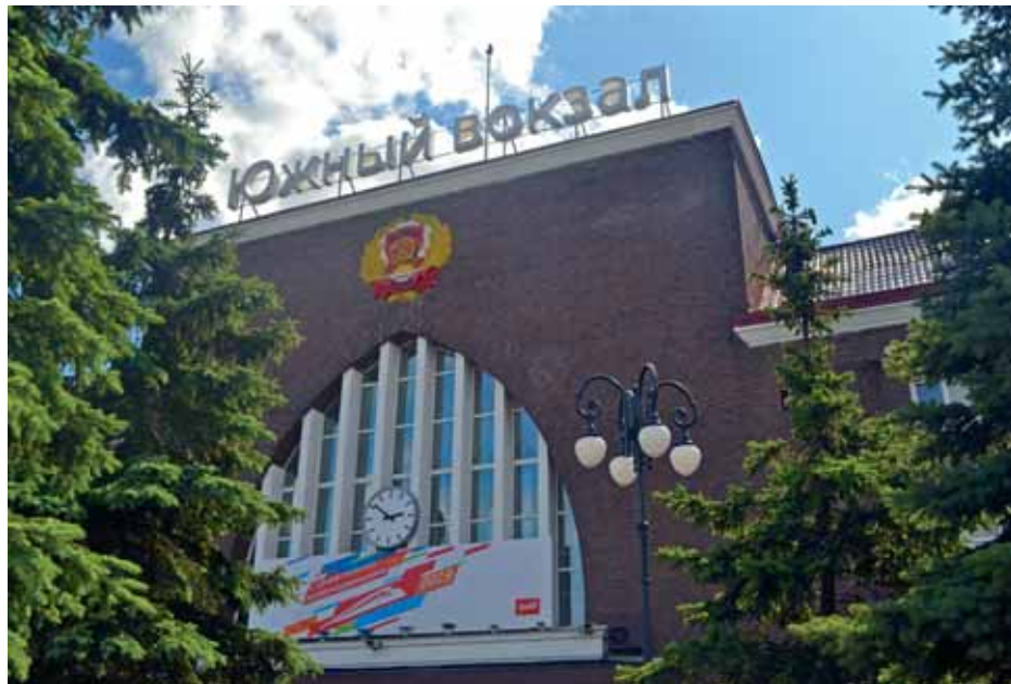
Žaljeznički kolodvor u Kaljinguadu

Katedrala je danas jedna od glavnih atrakcija Kalinjingrada, u koju turisti dolaze poslušati koncert na najvećim orguljama u Rusiji i razgledati Muzej Immanuela Kanta smješten na katovima iznad bazilike.