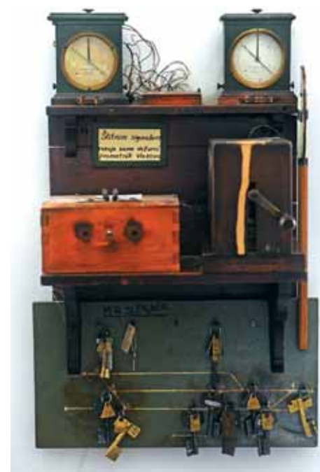
Uređaj za okretanje štitnoga signala