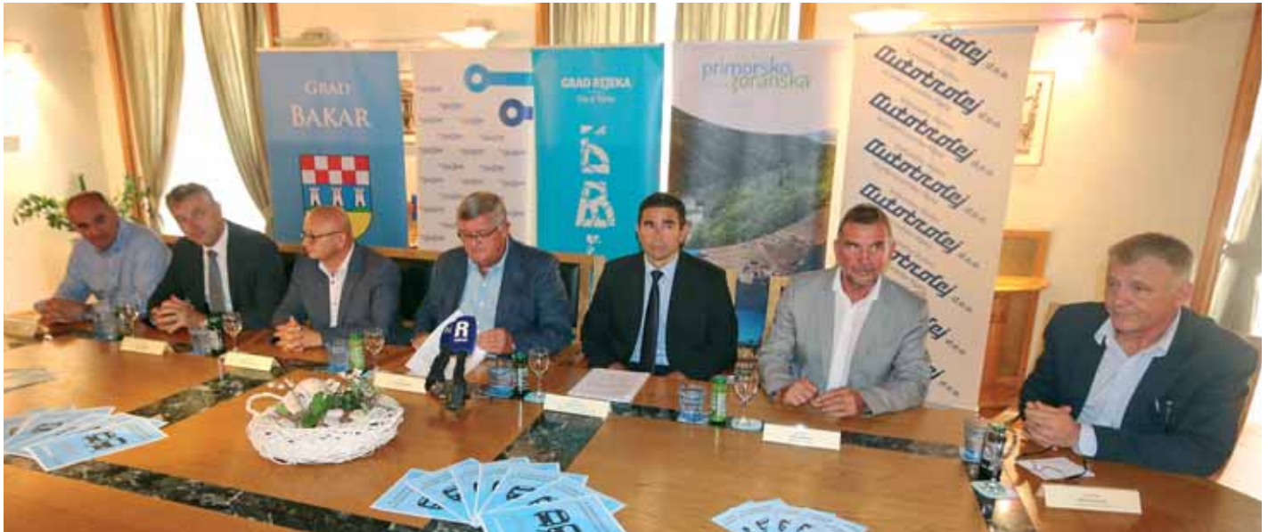
Potpisivanje ugovora o poslovnoj suradnji

O d 1. rujna na području Rijeke, Bakra i Matulja putnici će se u vlakovima moći voziti s kartama Autotroleja bez nadoplate.