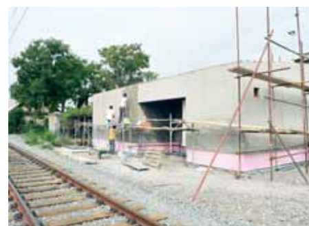
Nova zgrada za SS i TK uređaje

Kako bi se omogućio redoviti tijek prometa tijekom manevarskog rada, tunel se proširuje za još jedan kolosijek u ukupnoj duljini od 372 metra.