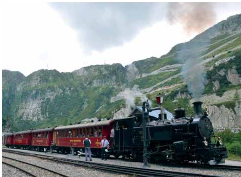
Vijetnamska lokomotiva HG 4/4 704 u kolodvoru Gletsch

tunel Furka, dug 15.381 metar. Iako je brdska dionica pruge prepuštena propadanju, entuzijasti iz čitave Europe su volonterskim radom omogućili da se ona pretvori u muzejsku željezničku prugu. Prva dionica muzejske pruge ponovno je otvorena 1992., a čitava pruga duga 17,8 km u ljeto 2010. Lokomotive koje danas voze na DFB-u dio su opsežnoga projekta nazvanog »Back to Switzerland!«. Naime, parne lokomotive koje su izvorno prometovale tom prugom prodane su 1947. u Vijetnam. Grupa entuzijasta ih je 1990. pronašla u Vijetnamu, otkupila ih, transportirala u Švicarsku i obnovila. Danas zupčane lokomotive serije HG 3/4 ponovno voze na pruzi za koju su proizvedene. U Vijetnamu su kupljene i dvije lokomotive HG 4/4 koje je proizvela švicarska tvrtka SLM, no koje nikada nisu vozile u Švicarskoj. Jedna od tih dviju lokomotiva (704) prvi je put na pruzi DFB-a vozila u subotu 31. kolovoza. Pruga DFB-a opremljena je zupčanim sustavom Abt, a maksimalni usponi iznose 118 ‰. Željeznica DFB radi od početka lipnja do