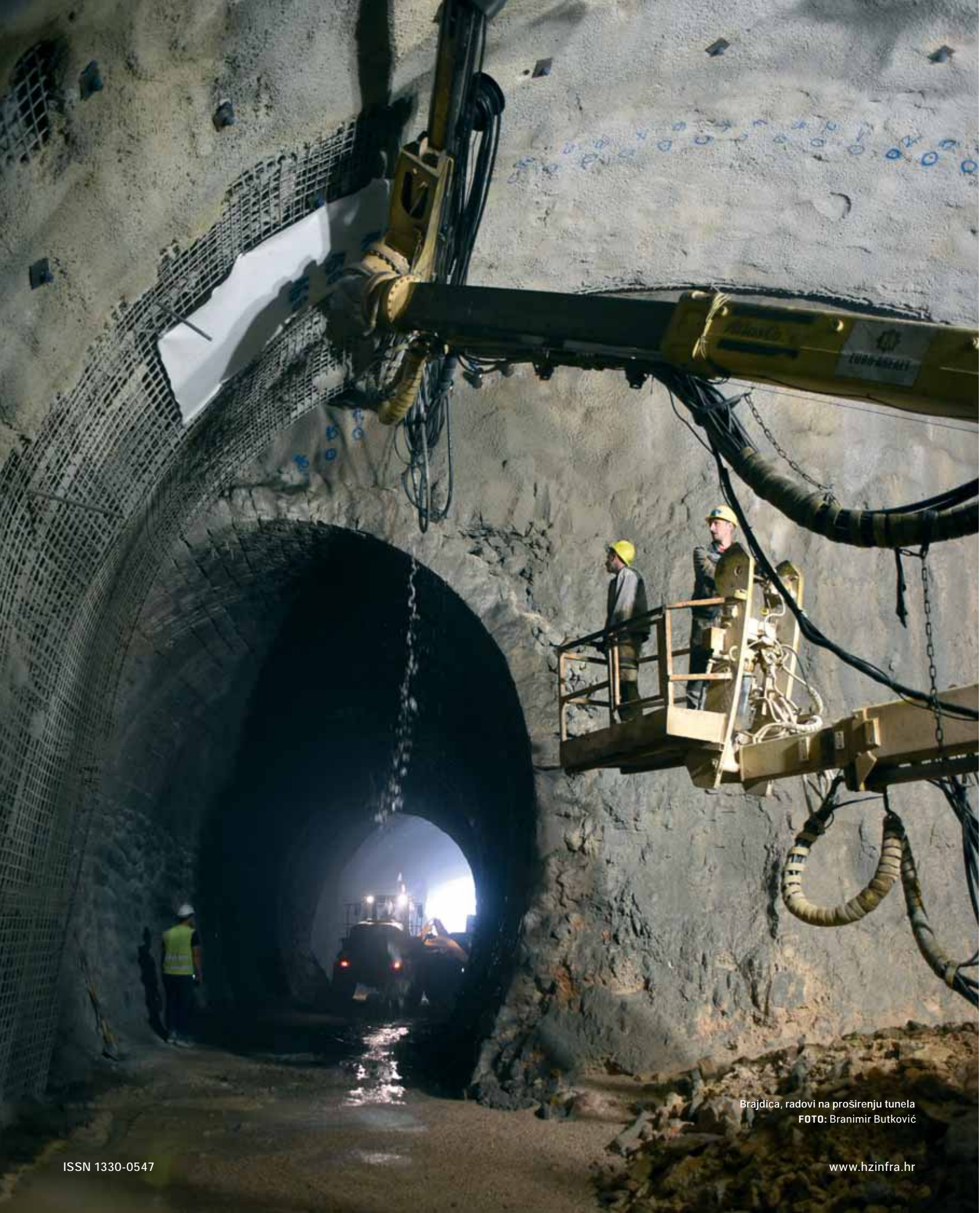
Brajdica, radovi na proširenju tunela