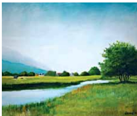
Autor Nikola Novosel

Na koloniji je proteklih godina sudjelovalo više desetaka autora različitih likovnih izričaja, stilova i tehnika koje su primijenili na motivima Gacke i njezina krajolika. Većina motiva bila je posvećena mirnoj i idiličnoj ljepoti Gacke i njezina krajolika te autentičnim zdanjima prastarih vodenica. S obzirom na to da većina sudionika kolonije dolazi iz cijele Hrvatske, svaki od njih sa sobom donosi motive zavičaja u kojemu žive i motive prostora koji su utjecali na oblikovanje njihova likovnog senzibiliteta. Tako je bilo i taj, 13. puta na koloniji u Otočcu.