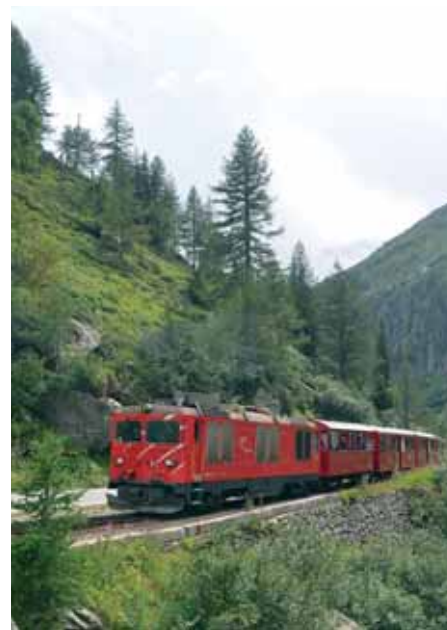
Vlak vučen dizelskom lokomotivom HGm 4/4 62

tunel Furka, dug 15.381 metar. Iako je brdska dionica pruge prepuštena propadanju, entuzijasti iz čitave Europe su volonterskim radom omogućili da se ona pretvori u muzejsku željezničku prugu. Prva dionica muzejske pruge ponovno je otvorena 1992., a čitava pruga duga 17,8 km u ljeto 2010. Lokomotive koje danas voze na DFB-u dio su opsežnoga projekta nazvanog »Back to Switzerland!«. Naime, parne lokomotive koje su izvorno prometovale tom prugom prodane su 1947. u Vijetnam. Grupa entuzijasta ih je 1990. pronašla u Vijetnamu, otkupila ih, transportirala u Švicarsku i obnovila. Danas zupčane lokomotive serije HG 3/4 ponovno voze na pruzi za koju su proizvedene. U Vijetnamu su kupljene i dvije lokomotive HG 4/4 koje je proizvela švicarska tvrtka SLM, no koje nikada nisu vozile u Švicarskoj. Jedna od tih dviju lokomotiva (704) prvi je put na pruzi DFB-a vozila u subotu 31. kolovoza. Pruga DFB-a opremljena je zupčanim sustavom Abt, a maksimalni usponi iznose 118 ‰. Željeznica DFB radi od početka lipnja do