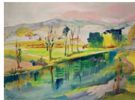
Autorica Ksenija Talijančić

Likovna kolonija »Likom Gacke« u suradnji s Udrugom željezničara slikara »Plavo svjetlo« iz Zagreba prvi je put održana u Otočcu 2003. Između 2011. i 2014. nije se održavala, a ponovno je pokrenuta 2015., otkada na koloniji sudjeluju i umjetnici s područja Otočca.