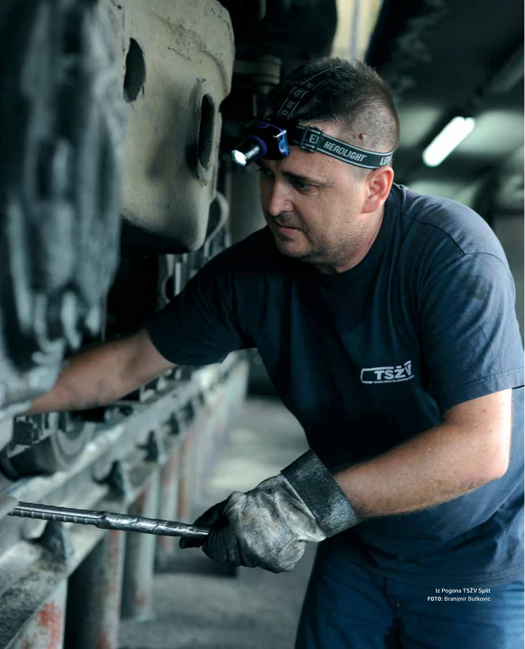
Iz Pogona TSZV Split