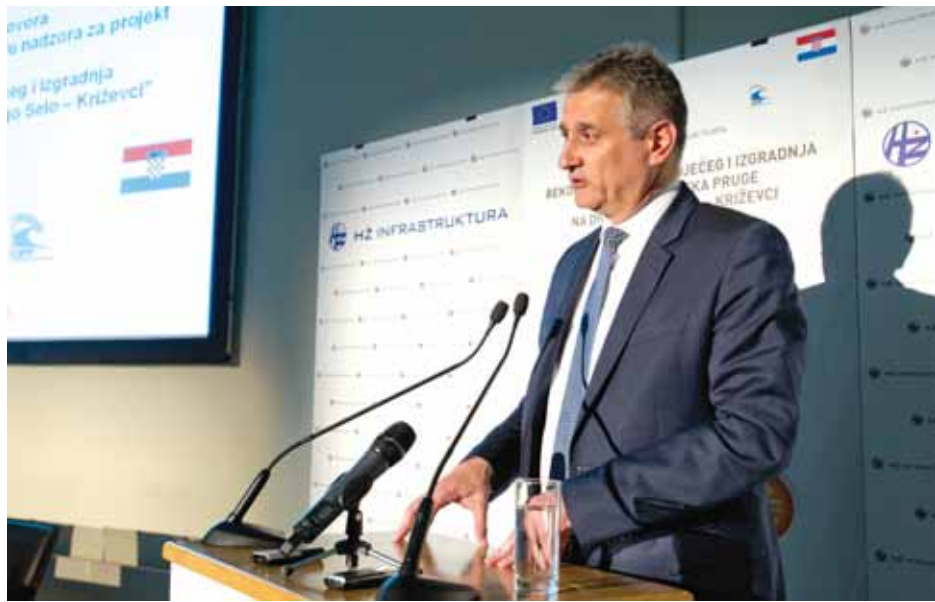
Prvi potpredsjednik Vlade Tomislav Karamarko

U OVOJ SITUACIJI KAD NAM JE SVAKO RADNO MJESTO BITNO OVAKVE INVESTICIJE VRIJEDNE SU SVAKE POHVALE. OVAJ JE PROJEKT PREKRETNICA, OD STRATEŠKE VAŽNOSTI ZA REPUBLIKU HRVATSKU.