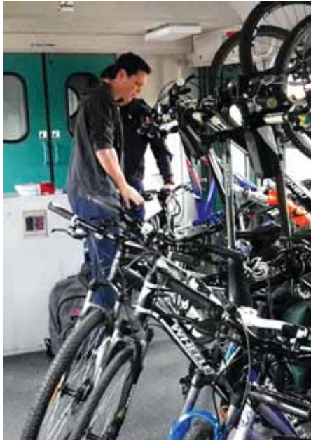
Vagon za prijevoz bicikala

Naša lakša ruta vodila je do ulaza u Park prirode Lonjsko polje, tj. do novoga prijamnog centra u Repušnici, u kojemu je bila organizirana kraća okrpjeka. Iznenađili su nas najmlađi sudionici koji su bez problema odvozili prvi dio rute, a tako su nastavili i natrag do Kutine. Na ulazu u grad nastavili smo voziti jedan krug da bismo stigli na jezero Bajer, gdje je organizator pripremio zabavu u zelenome okružju. Iako više nije bilo vruće kao ujutro, sunce nas je i dalje tu i tamo razveselilo, no nije nam bilo hladno. Malo vjetro smetalo je samo ribičima jer