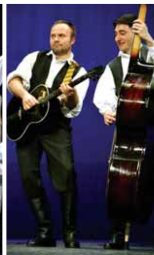
Folklorne i tamburaške sekcije KUD-a HŽ-a Varaždin

A i mladi su izvođači bili odlični: najmlađi su pokazali korektno znanje koreografije. Oni stariji koji sada čine standardni sastav pokazali su visoku razinu profesionalnosti, osobito tijekom izvođenja koreografije Međimurja i Banatskih igara. Između pojedinih koreografija soloprogramom nastupio je Tamburaški sastav u čijem su sastavu bili sadašnji svirači, ali i seniori koji su nekad »nosili« zvuk Društva.