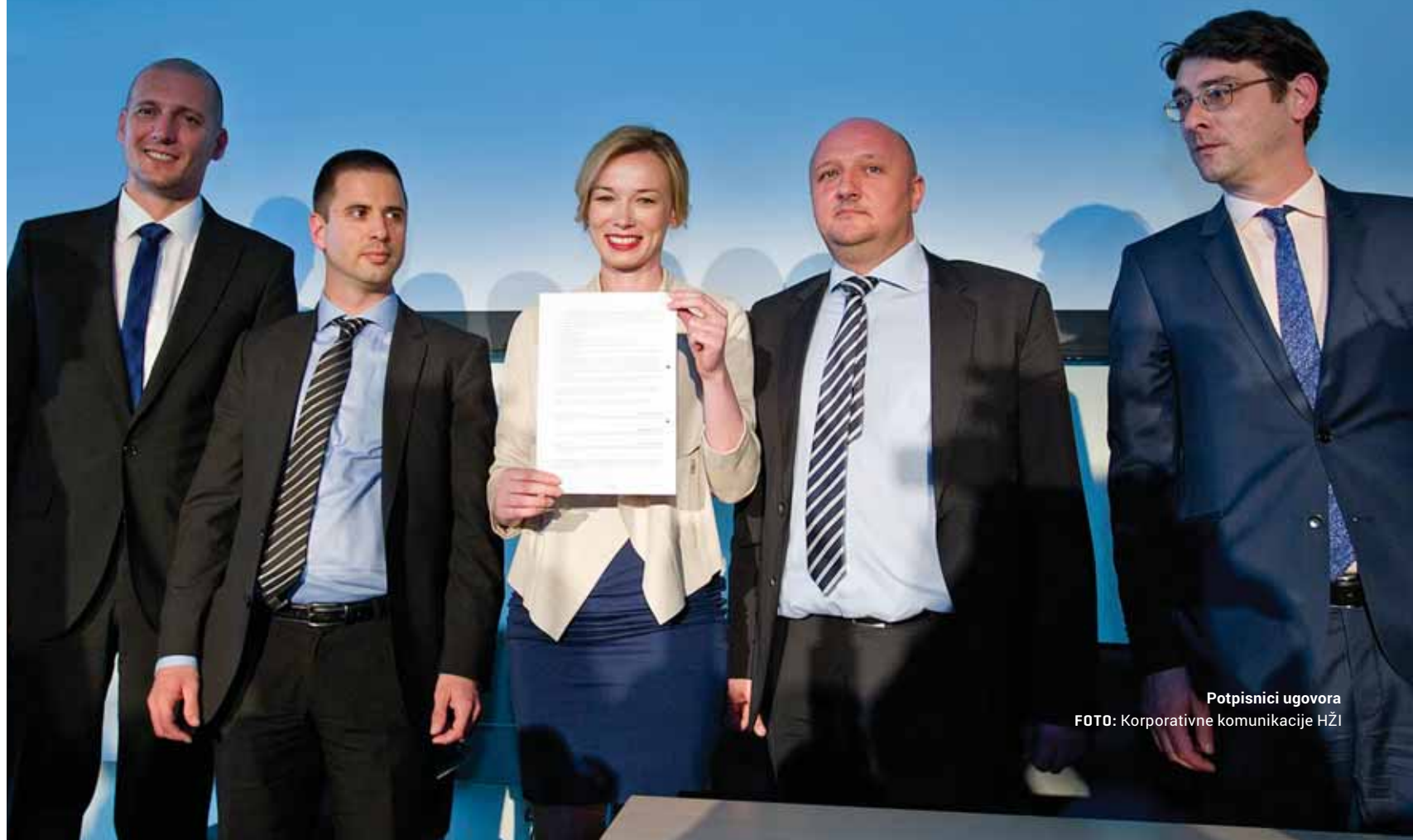
Potpisnici ugovora