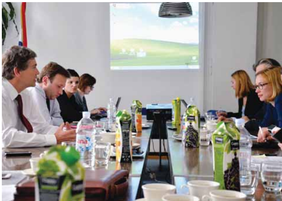
Visoka delegacija CER-a u posjetu Hrvatskoj

HŽ Infrastruktura predstavila je svoje ključne infrastrukturne projekte održavanja i modernizacije željezničke mreže. Posebice je istaknuto intenziviranje aktivnosti u posljednjih nekoliko mjeseci na dvama projektima koji su sufinancirani s 85 posto EU-ovih sredstava. Riječ je o projektima rekonstrukcije postojećeg i izgradnje drugog kolosijeka željezničke pruge na dionici Dugo Selo – Križevci (početak radova tijekom ljeta) te izgradnji nove pruge na dionici Gradec – Sveti Ivan Žabno (radovi u tijeku) čija ukupna vrijednost iznosi milijardu i 457 milijuna kuna. Predstavljeni su i brojni budući EU-ovi projekti među kojima su i tri najaktualnija u vrijednosti od milijardu i 300 milijuna kuna. Riječ je o projektima Rekonstrukcija i elektrifikacija pruge Vinkovci – Vukovar, Rekonstrukcija i elektrifikacija pruge Zaprešić – Zabok te Rekonstrukcija željezničkog kolodvora Rijeka-Brajdica i izgradnja intermodalnog kontejnerskog terminala Brajdica.