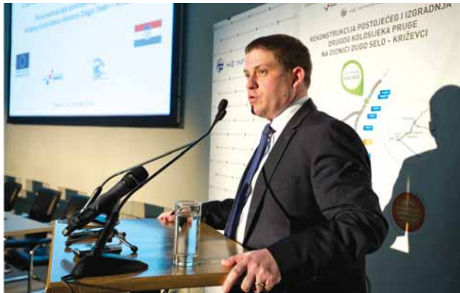
Ministar pomorstva, prometa i infrastrukture Oleg Butković

DRAGO MI JE DA OVO RADE HRVATSKE TVRTKE, DOKAZALI SMO DA IMAMO LJUDE KOJI MOGU REALIZIRATI PROJEKTE TE DA IMAMO OPERATIVU I SPOSOBNE GRAĐEVINSKE TVRTKE.