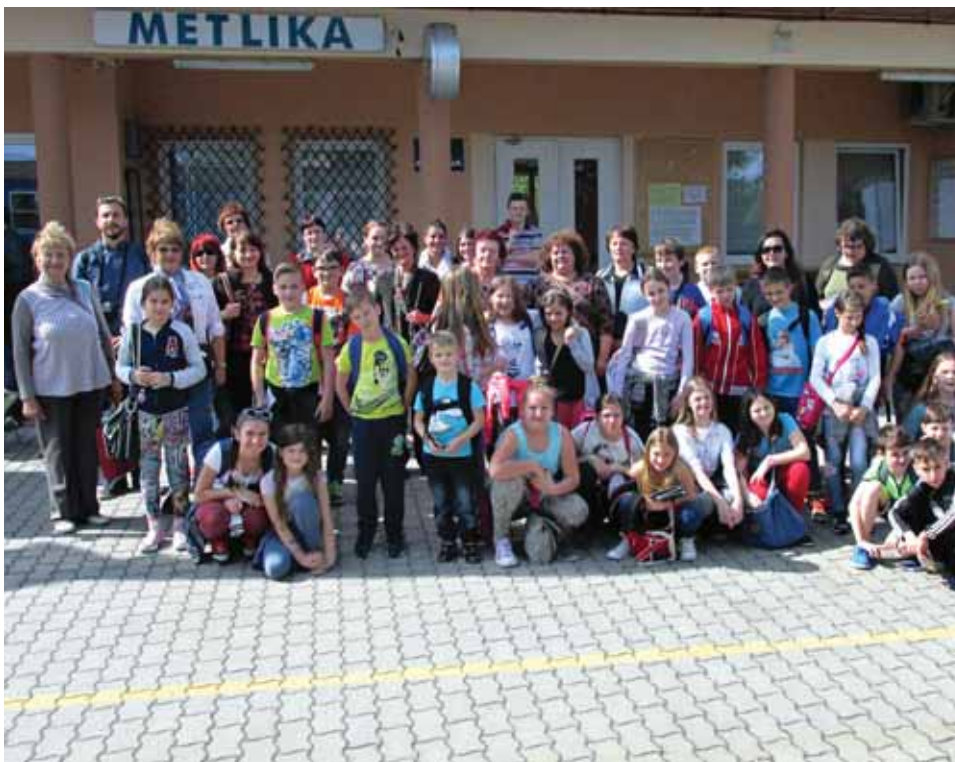
Sudionici putovanja vlakom knjige i prijateljstva u povodu »Noći knjige«