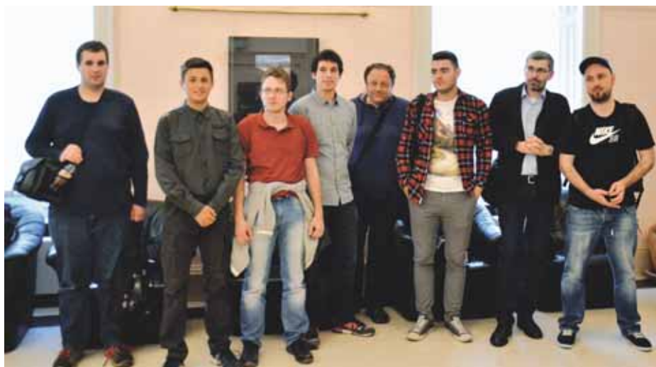
Dio autora izloženih fotografija