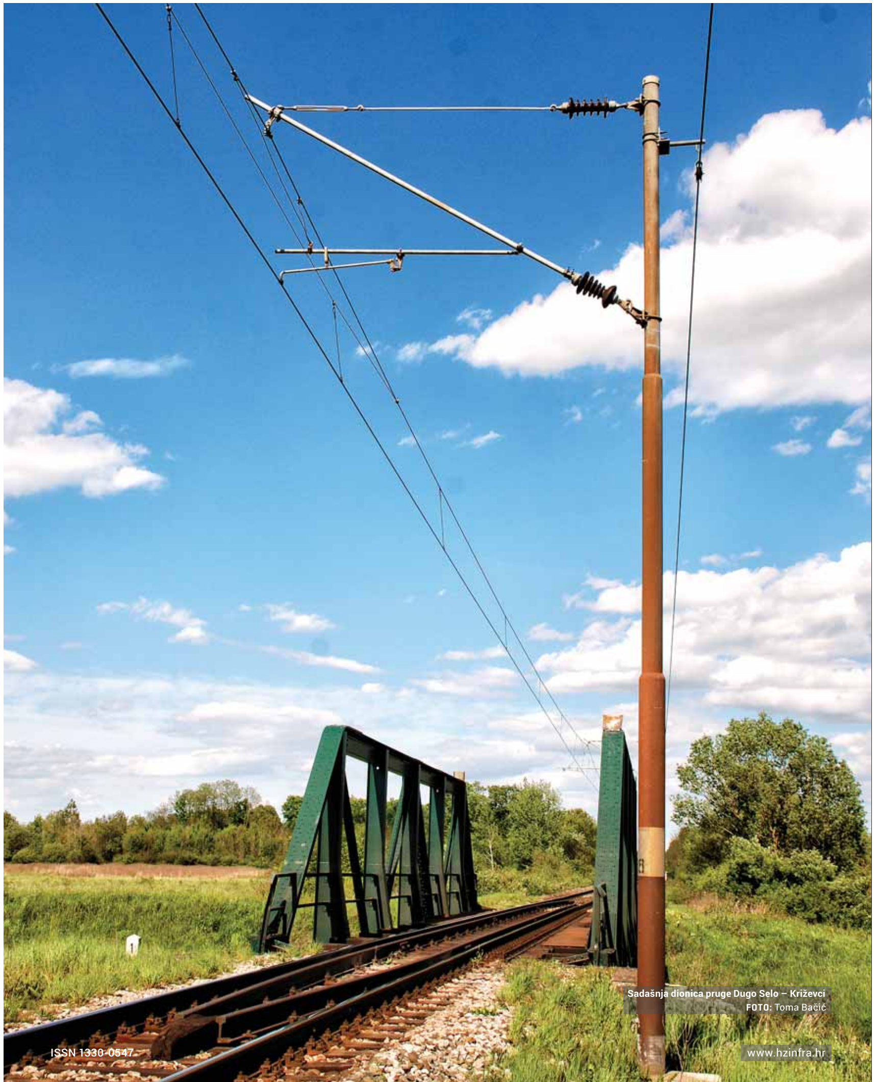
Sadašnja dionica pruge Dugo Selo – Križevci