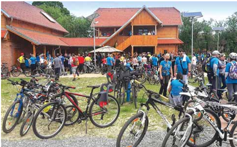
Park prirode Lonjsko polje, prijamni centar u Repušnici

U subotu 4. lipnja bit će još jedna prilika za pedaliranje po tome kraju, a planira se obilazak gotovo cijeloga Lonjskog polja. I na tu biciklijadu od Zagreba do Sunje vozit će Lonja Bike-express. Iz Sunje biciklisti će nastaviti vožnju prema Čigoču, Mužilovčici, Krapju i Jasenovcu, gdje će ih čekati vlak za povratka na početno mjesto biciklijade ili u Sisak i Zagreb. Uz ostale sadržaje, organizator PP Lonjsko polje priprema i vožnju novim brodom po Savi, ručak i veliku feštu u Krapju.