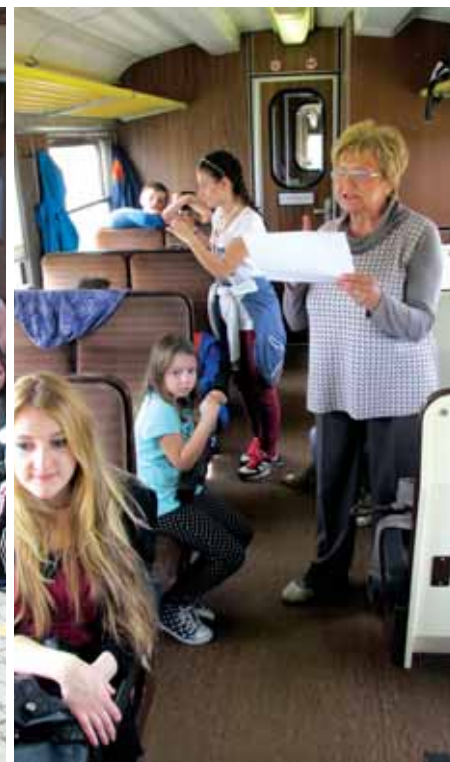
Ugođaj u vlaku

O ve je godine manifestacija »Noć knjige« održana u 224 grada i mjesta diljem Hrvatske, uz 527 sudionika i više od 1000 programa. Obilježavanju Dana hrvatske knjige i Svjetskog dana knjige i autorskih prava pridružio se i HŽ Putnički prijevoz.