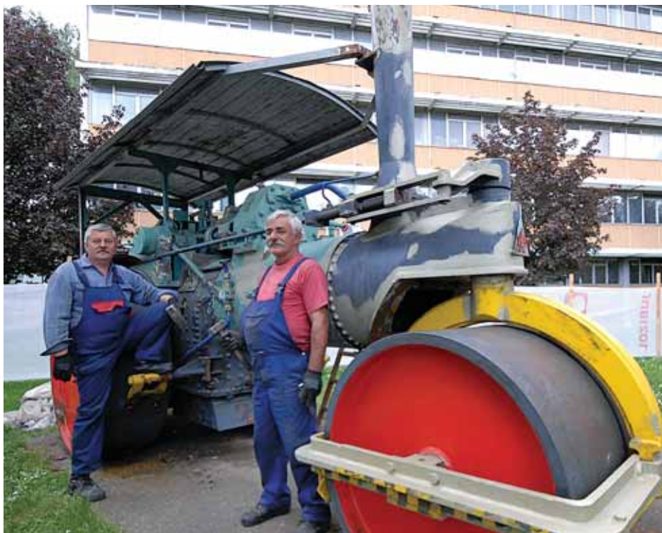
U tijeku je obnova parnog stroja

PIŠE: Branimir Butković