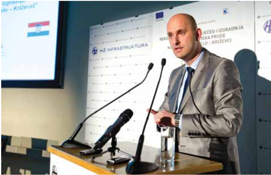
Ministar regionalnog razvoja i fondova EU-a Tomislav Tolušić

SRETAN SAM ŠTO SMO KONAČNO KRENULI S VELIKIM PROJEKTIMA U SEKTORU ŽELJEZNICE. OVAJ PROJEKT OTVARA VEZU RIJEKE S JUGOISTOČNOM EUROPOM, NA MEDITERANSKOM KORIDORU KOJI RAZVIJA CIJELU HRVATSKU.