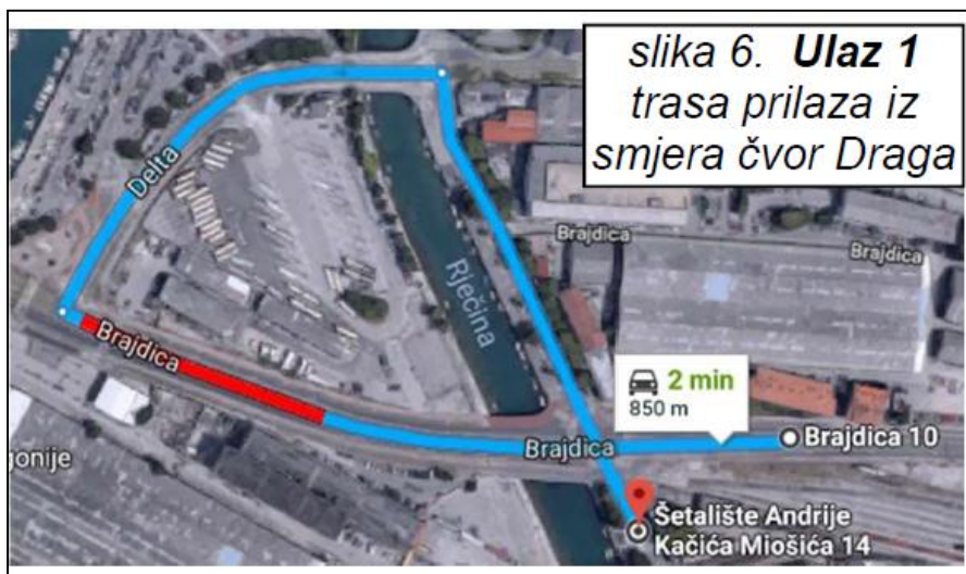
Slika Ulaz 1.

Zbog izvođenja radova na kontejnerskom terminalu Brajdica i željezničkom kolodvoru Rijeka-Brajdica biti će pojačan promet kamiona i drugih vozila na prilaznim prometnicama. U vrijeme izvođenja radova gradilišni priključci nalaze se na lokacijama ULAZ 1, 2, 3 kako je prikazano na slikama u nastavku. Intenzitet korištenja pojedinih prilaza ovisit će o dinamici izvođenja radova. Izvođač može povremeno pojedine prilaze i zatvoriti, ali privremena prometna signalizacija će ostati cijelo vrijeme tijekom izvođenja radova u projektu.