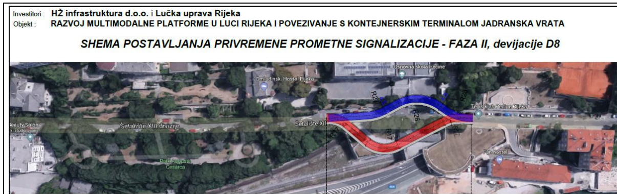
Slika 1. Privremeno izmještanje (devijacija) u ulici Šetalište XIII divizije

Postojeće autobusno stajalište Pećine bit će izmješteno na novu lokaciju ispred zgrade u ulici Šetalište XIII. divizije 30, što je udaljeno do 35 m od privremenog pješačkog prijelaza.