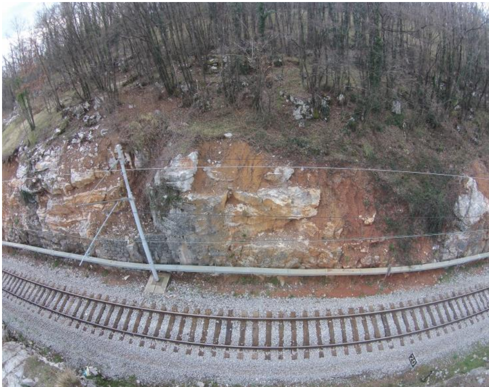
Slika 1. Usjek u km 40+680/780

NAZIV GRAĐEVINE: Usjek u km 40+680/780 na pruzi M203 Rijeka – Šapjane – DG (pruga i km položaj)